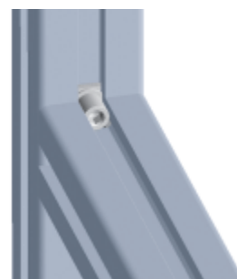
Set Anschraubverbinder Set Screw-on Connector